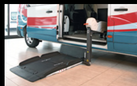
Porte latérale avec élévateur Fiorella.