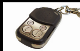
Télécommande sans fil fournie.

Pour en savoir plus, rendez-vous sur www.opel.ch